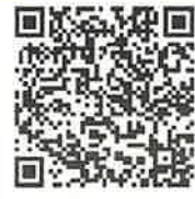
ふるさとチョイス