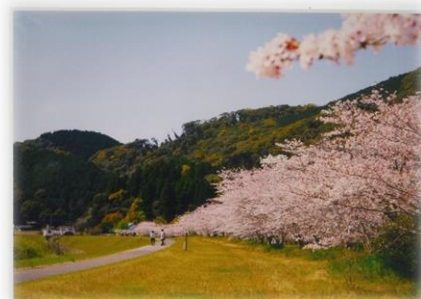
前年度コミ協会長賞