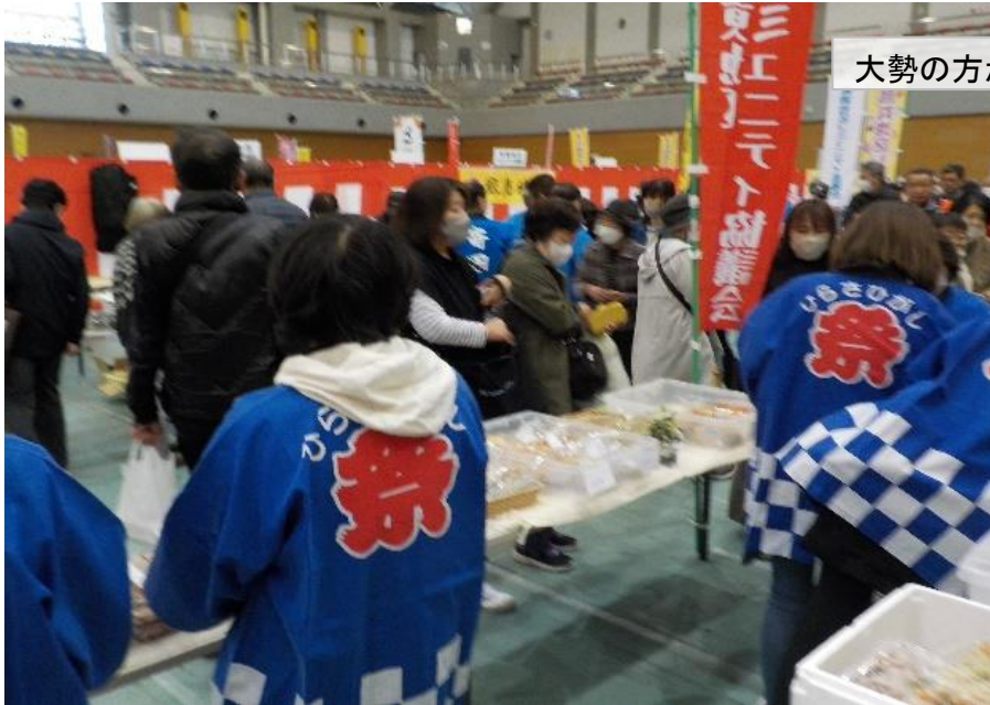
大勢の方が来場されました