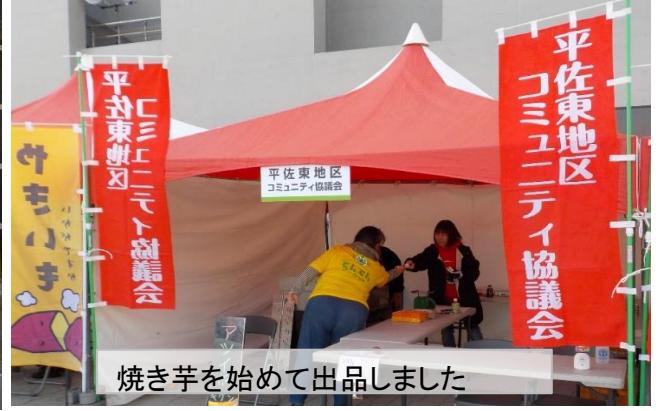
焼き芋を始めて出品しました