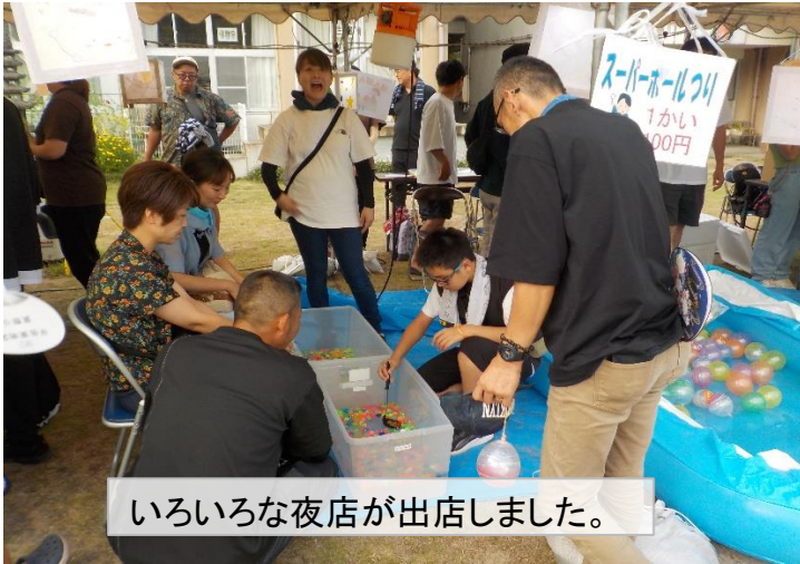
いろいろな夜店が出店しました。