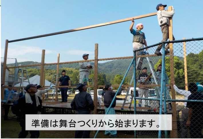
準備は舞台づくりから始まります。