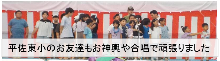
平佐東小のお友達もお神輿や合唱で頑張りました