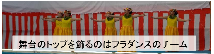
舞台のトップを飾るのはフラダンスのチーム