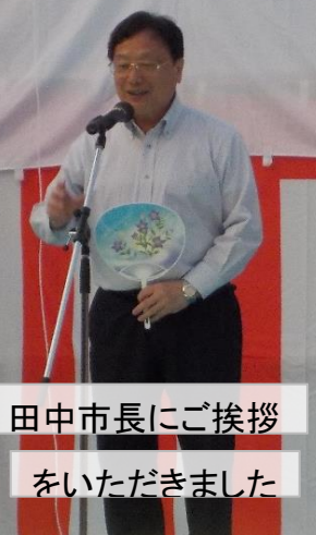
田中市長にご挨拶 をいただきました