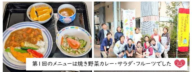
第1回のメニューは焼き野菜カレー・サラダ・フルーツでした

また、運営に必要な食材の寄付や応援募金、ボランティアも募集しておりますのでご協力をお願いします。