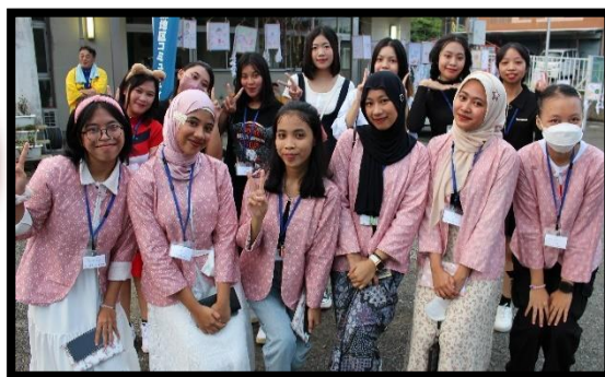
インドネシア・ベトナムの実習生