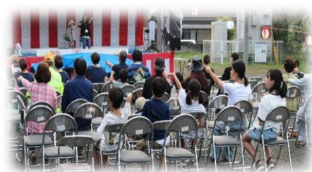
はんとけん体操体験