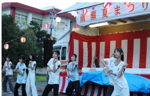
薩摩中央高等学校ダンス部