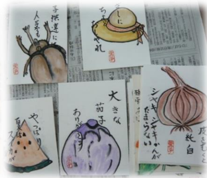
元気づくり運動教室