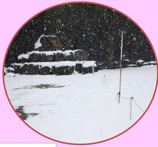
コミセングランドです！