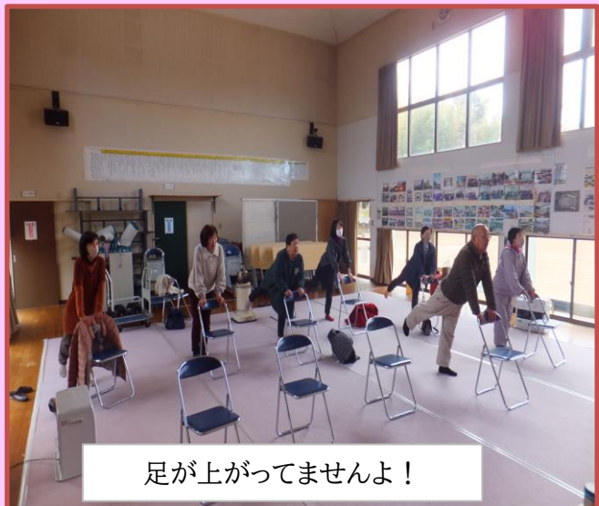
足が上がってませんよ！

毎月第二木曜日に、コミセンで『はんとけん体操』を行ってます。2月の参加者は、寒さの影響で少なかったですが、久々の再開で世間話に花が咲きました。体操の後は、頭の体操を行い、心身ともにリフレッシュしました。皆様の参加をお待ちしております。