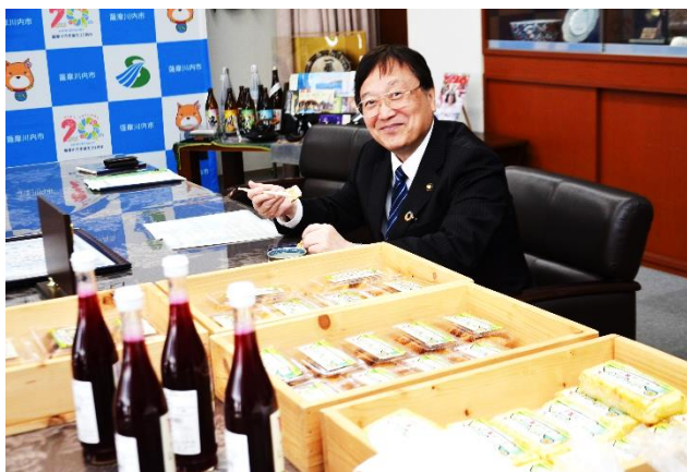
写真 大馬越地区特産品商品とおかべ を試食される田中薩摩川内市長

令和七年二月四日(火)鹿児島市県民ホールにて令和六年度鹿児島県コミュニティづくり推進大会の席で、大馬越地区コミュニティ協議会が地区コミュニティ組織部門県知事優秀賞受賞を記念して、この程三月七日(金)午前十時から本庁応接室にて、特産品支援グループ一行が市長に表敬訪問をさせて頂きました。市長からこれまでのねぎらいと今後の活躍を更にモデルケースになるよう激励の言葉を頂いた所であります。当日は特産品「お活動も兼ねて特に市長にまごえのおかべ(トーフ)を試食してもらいこれはうまいと満面の笑みを頂きました。