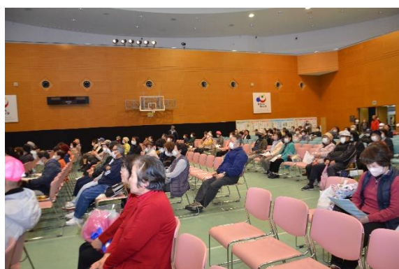
サンアリーナの鑑賞者