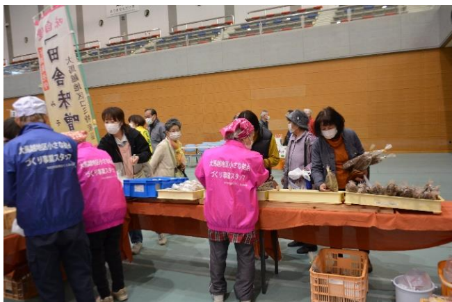
新鮮な新ごぼう10分で70袋速完売