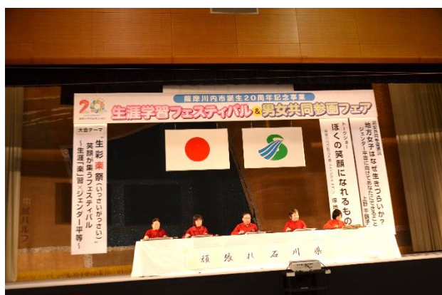
大正琴自主講座 琴の音色にうっとり