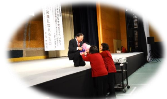
歌の終わりには花束の贈呈もありました