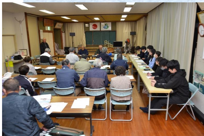
写真: 第2回地区文化祭実行委員会

第二回大馬越地区文化祭実行委員会が十二月五日(木)午後七時から部会終了後開催されました。今回は鹿児島県庁職員五名・薩摩川内市職員三名も参加して企画案の討論に加わって頂きました。当日は支援の職員から自己紹介もあり、地区文化祭と一緒に盛り上げたいとの決意をして頂きましたので、大変楽しみにしているとところであります。今回の協議内容は次のとおりとなっておりますが、舞台出演責任者は、期限までに申し込みを済まされるようお願いいたします。