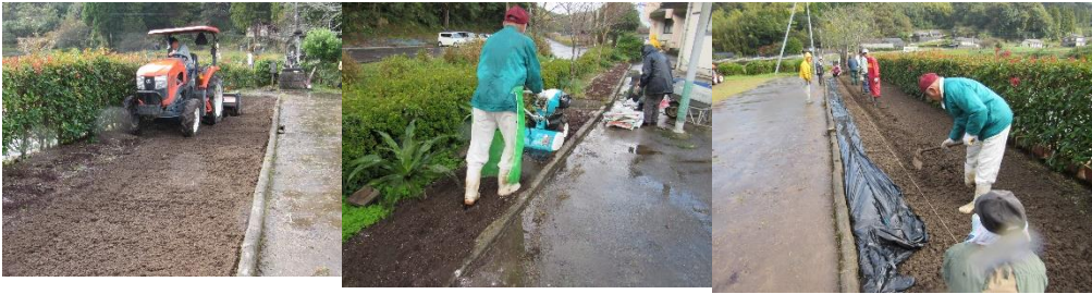
事前作業トラクター・管理機による耕運及び黒マルチ張り