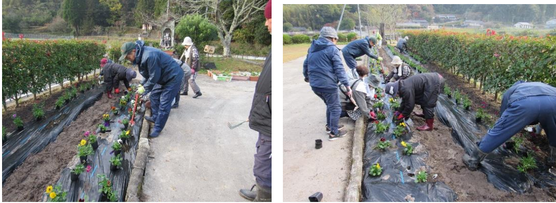
青少年環境地域づくり部会及び各自治会からの支援を受け花苗植栽模様

本年二回目となります。コミセン花壇に来春用の花苗植栽を各自治会から一名ずつ支援を頂きながら、実施いたしました。事前作業につきましては十一月二十八日(木)、青少年環境地域づくり部会の役員で耕運からマルチ張り迄頑張って頂きました。植栽につきましては、十二月七日(土)午前八時から少々の雨が降る中での作業でありましたが、部会員全員及び各自治会からの支援を頂き、鹿よけのネット設置まで行って頂きました。花苗の種類は、パンジー四百四十本、ビオラ百十二本、葉ボタン五十六本、なでしこ五十六本、ノースポール五十六本の計四百二十本を植栽して頂きました。この中にはプランターにも植栽してありますが、来年二月十六日の大馬越地区文化祭時に舞台の袖に色とりどりの花百花繚乱となることと思っております。是非楽しみにしておいてください。