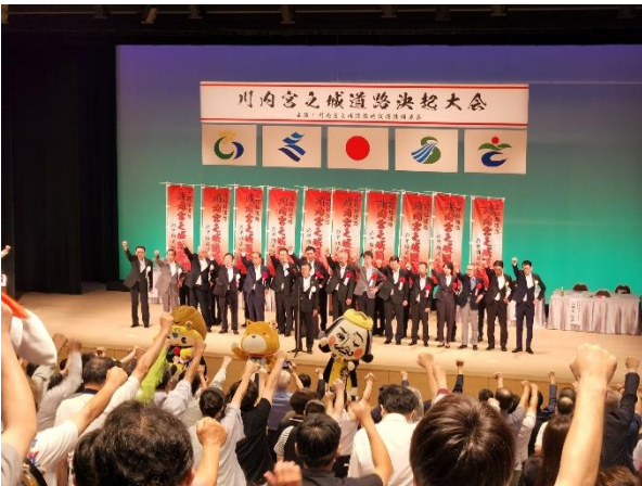
各地区から参加数 700名 大馬越地区コミからも参加いたしました

令和六年八月三日(土曜日)、SSプラザ せんだいにおいて、昨年に続き二年連続となる川内～宮之城道路決起大会を川内宮之城道路建設促進期成会の主催により開催されました。当該道路の早期実現を関係機関に強くアピールするため、地元選出の国會議員や県知事及び市議會議員等多くの来賓の方々が参加され、北薩地域から川内港への交通アクセスの向上は喫緊の課題であり、高規格道路網と川内港の機能を最大限に活用した物流の拡大と効率化、を図るために直結された道路のネットワークの形成が不可欠であるとのことで大会決議案が採択されました。