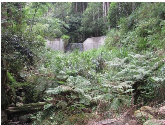
内之尾黒武者正利宅手前の砂防ダム 土砂堆積状況確認 土砂堆積有