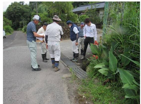
吹田紘男宅前の市道と国道との交差 点付近 柵専用のグレーチングが外れ ないように留め金の設置要望