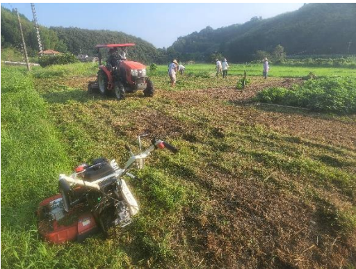
猛暑の中での収穫後のしそ畑整地作業

本年度産のしそ製造は七月初旬に完了し、現在コミセン他市内の物産館等で販売されています。今年初めて製造いたしました無糖しそジュースにつきましては、お陰様で完売となりました。赤・青ジュースにつきましては、事務局に在庫があります。しそ畑借地につきましては、猛暑続きの中での整地作業となりましたが、特産品支援員の方々は熱中症にならないよう水分補給をしっかりと行いながら作業を行い、今年を振り返っていただきました。お疲れ様でした。