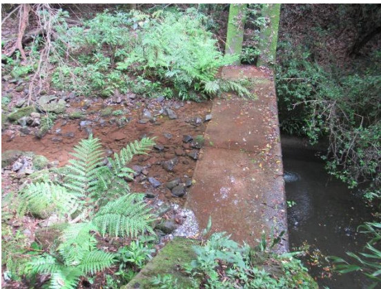
内之尾坂元自治会長宅上の砂防ダム 土砂堆積状況確認 土砂堆積有