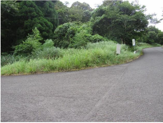
内之尾自治会方向に向けて三差路付近の 除草作業依頼

国道敷きの要望につきましては、後日入来地域会長合同名で要望することとしておりますので、現地調査は割愛させて頂きました。また、事前に入来支所が把握している箇所についても、現地調査は省略してあります。今回の現地調査結果については8月29日(木)運営委員会に支所から報告がなされることとなっております。主な現地調査箇所を掲載しました。