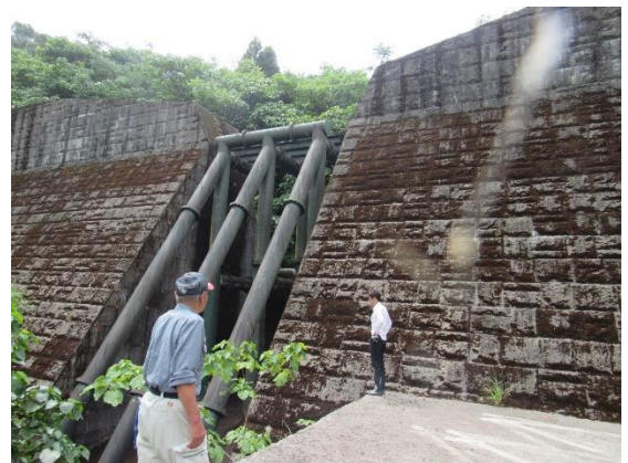
手打公平宅上の砂防ダム土砂堆積状況 土砂堆積無し