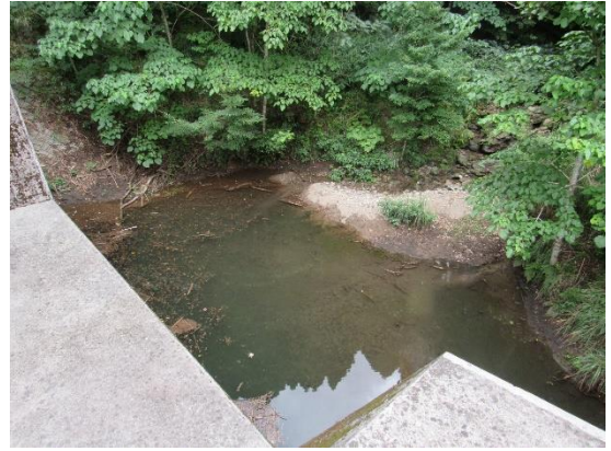
手打公平宅上の砂防ダム土砂堆積 状況確認 土砂堆積無し