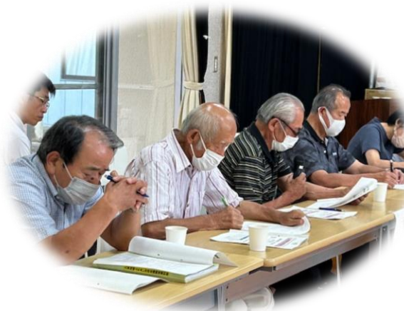
大馬越地区からは3名が参加しました

本年度七月四日(木)東郷公民館にて令和市民トークが開催されましたが、今回入来地域限定の市民トークが清色コミセンにて開催されました。当日の討議は「入来地域人口減について」に絞って各地区コミ会長から市長に意見交換会として実施されました。事前に各地区から一項目ずつ課題を説明し、市長が回答する方式で開催されました。この人口減対策については、本市、本県更には全国的な課題であって即座に解決できない事項であり、今後本市に於かれましては第三次薩摩川内総合計画(案)十年間に盛り込んで行かれる予定となっています。