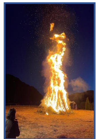
令和5年度鬼火焚きの様子です。

準備をR6年12月22日(日)に行いました。多くの方のお手伝いありがとうございました。