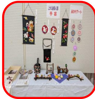
上大迫女性部 手芸